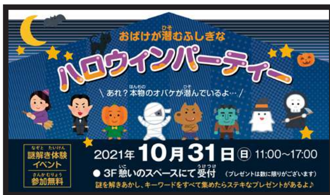
●「ハロウィンパーティー」イベントの告知