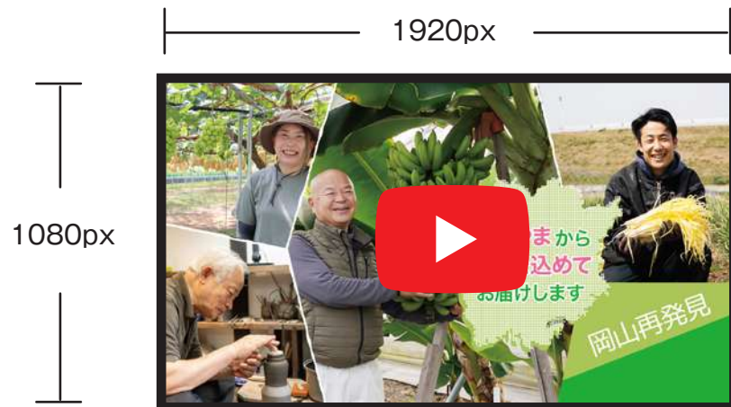
●通販サイト「おかチョク」の紹介